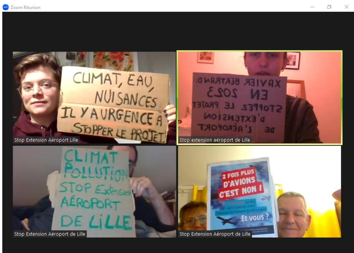
Capture d'écran regroupant les messages destinés à Xavier Bertrand concernant l'extension de l'aéroport de Lille-Lesquin

L'association NADA Lille, créée pour ester en justice contre le projet d'extension, est porteuse avec France Nature Environnement Hauts-de-France et Nord Nature Environnement d'un recours juridique contre l'autorisation environnementale décernée par le préfet le 6 juillet dernier. La date d'audience de ce recours n'est toujours pas connue.